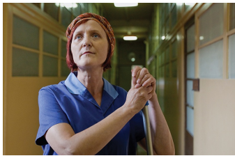
Damals nach der DDR