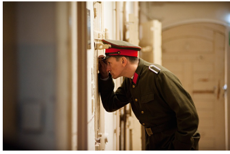
Und der Zukunft zugewandt