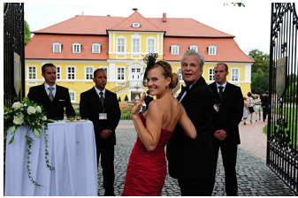
Mann tut was Mann kann