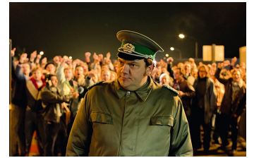
Bornholmer Straße (Wanzleben)