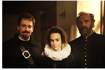
Die eiserne Zeit - Lieben und Töten im Dreißigjährigen Krieg