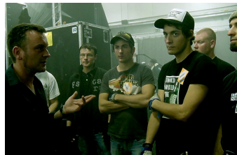
We are the Roadcrew