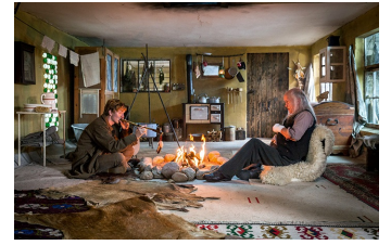
Axel der Held