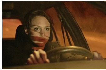
Die getäuschte Frau