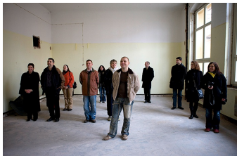
Heute war damals Zukunft