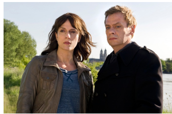
MDR Polizeiruf - Der verlorene Sohn