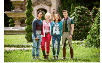
Bibi und Tina - Voll verhext (Vitzenburg)