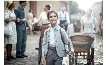
Lauf Junge Lauf (Zörbig)