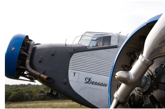
Bis zum Horizont, dann links