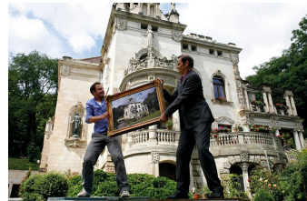
Wie erziehe ich meine Eltern