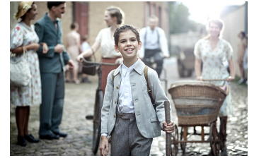
Lauf Junge Lauf (Zörbig)