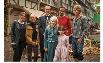
Heidi (Halberstadt, Quedlinburg)