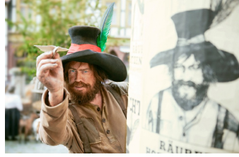
Der Räuber Hotzenplotz (Blankenburg, Quedlinburg, Langenstein)