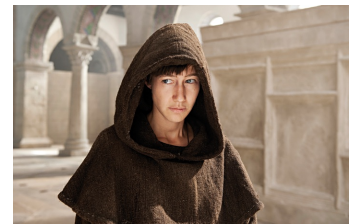
Die Päpstin (Ilsenburg)