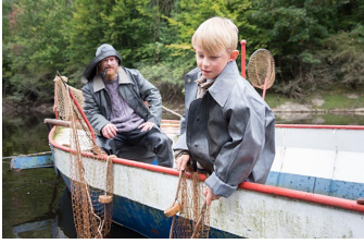
Der Krieg und ich - Kindheit im Zweiten Weltkrieg (Blankenburg, Thale)