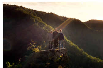
Wenn die Welt uns gehört (Thale)