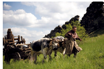
Black Death (Blankenburg, Thale)