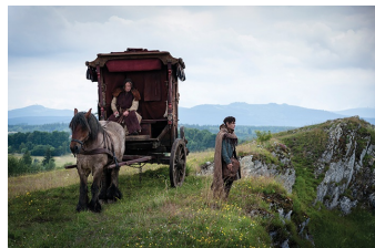
Der Medicus (Blankenburg, Elbingerode, Thale)