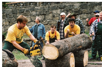
Die Könige der Nutzholzgewinnung