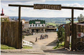
Winnetous Sohn (Blankenburg, Hasselfelde, Thale)