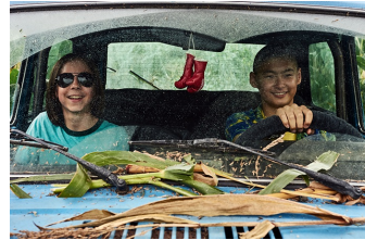
Tschick (Blankenburg, Thale)