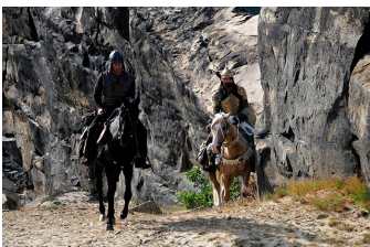
1 1/2 Ritter - Auf der Suche nach der hinreißenden Herzelinde (Blankenburg, Thale)