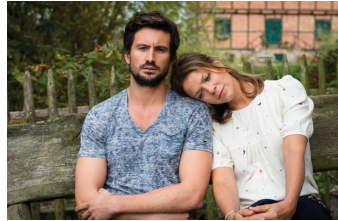
Stadtlandliebe (Blankenburg, Thale)