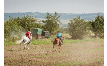
Bibi und Tina - Voll verhext (Blankenburg, Thale)