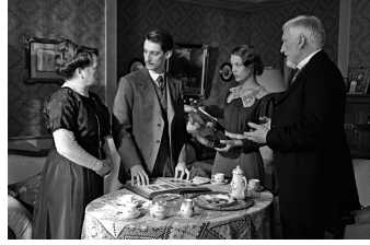
Frantz (Blankenburg, Friedrichsbrunn)