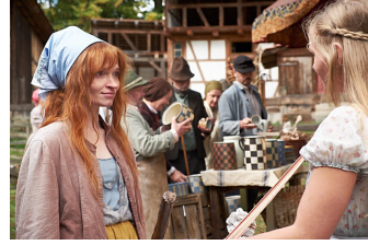
Die kleine Hexe (Blankenburg)