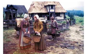
Schneeweißchen und Rosenrot (DEFA 1979)

Filmdatenbank der MDM unter: www.mdm-online.de > Film Commission > Drehreport