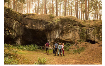
Bibi und Tina - Mädchen gegen Jungs (Blankenburg, Rübeland, Thale)