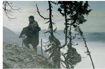
Judgment - Grenze der Hoffnung