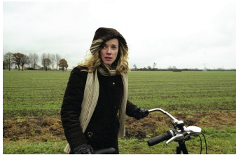
Die Zeit nach der Trauer