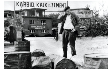
Karbid und Sauerampfer (DEFA 1963)

Filmdatenbank der MDM unter: www.mdm-online.de > Film Commission > Drehreport