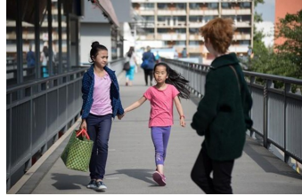
Ente Gut! Mädchen allein zu Haus