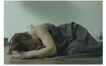
Einsamkeit und Sex und Mitleid