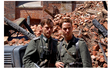
Unsere Mütter, unsere Väter