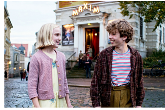
Timm Thaler oder das verkaufte Lachen