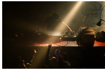
Als wir träumten