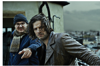
Zorn - Tod und Regen