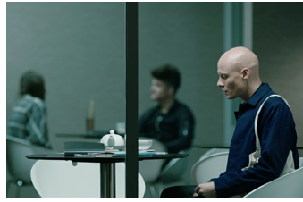
Touch me not