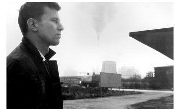
Der geteilte Himmel

Film Datenbank der MDM unter www.mdm-online.de > Film Commission > Drehreport