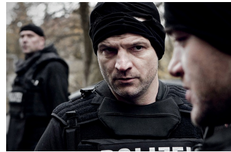
Wir waren Könige