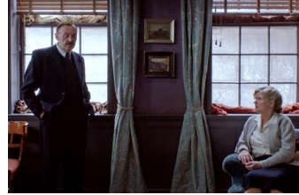
Vor der Morgenröte