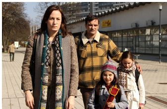
Circles | Kreise