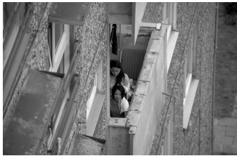
Wir sind jung. Wir sind stark.