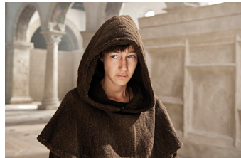
Die Päpstin (Gernrode, Harzgerode)