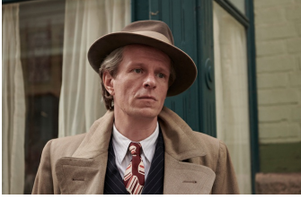
Leonora im Morgenlicht (Quedlinburg)