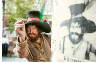
Der Räuber Hotzenplotz (Blankenburg, Quedlinburg, Langenstein)