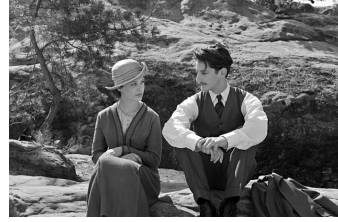
Frantz (Quedlinburg, Wernigerode)