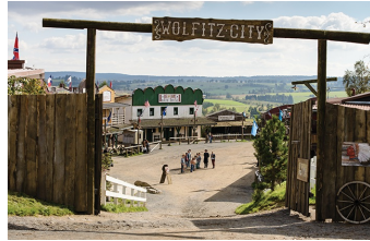
Winnetous Sohn (Halberstadt, Thale)