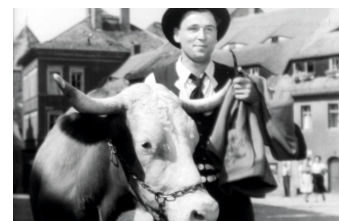
Der Ochse von Kulm

Liste von Dreharbeiten in der Stadt Görlitz www.goerlitz.de/Goerliwood-Filmografie.html