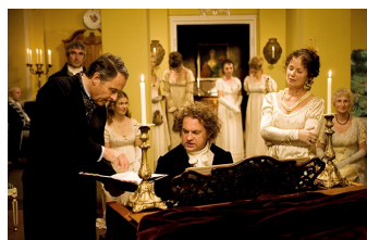
Giganten - Ludwig von Beethoven