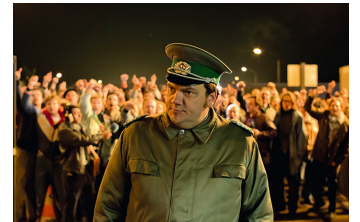
Bornholmer Straße (Wanzleben)