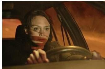
Die getäuschte Frau