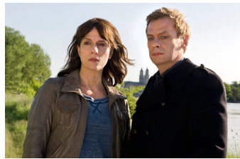
MDR Polizeiruf - Der verlorene Sohn