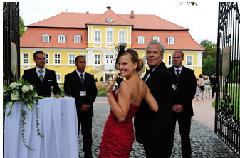
Mann tut was Mann kann