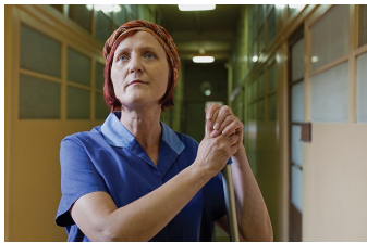
Damals nach der DDR