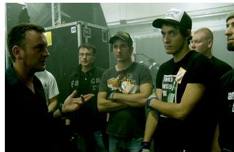
We are the Roadcrew