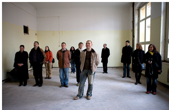
Heute war damals Zukunft