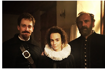
Die eiserne Zeit - Lieben und Töten im Dreißigjährigen Krieg