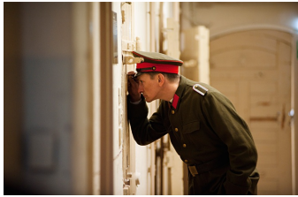
Und der Zukunft zugewandt