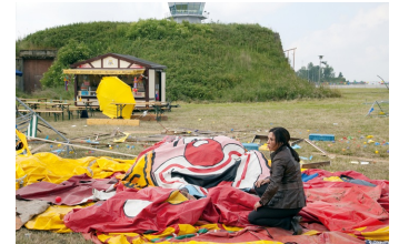
Tatort, Episode: Absturz

Filmdatenbank der MDM unter www.mdm-online.de > Drehreport