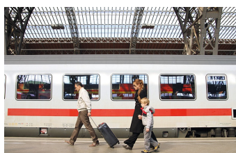
Circles | Kreise