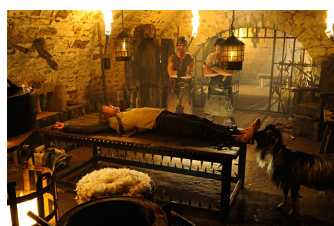
1 ½ Ritter - Auf der Suche nach der hinreißenden Herzelinde (Eckartsberga)