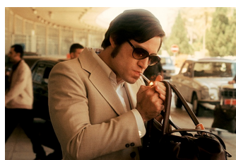
Carlos - Der Schakal (Naumburg)