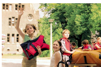
Bibi Blocksberg und das Geheimnis der blauen Eulen