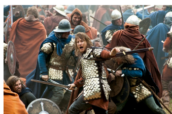
Die Päpstin (Schulpforte)