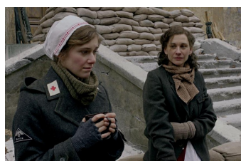
Unsere Mütter, unsere Väter (Zeitz)