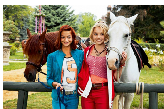
Bibi und Tina - Der Film (Vitzenburg)