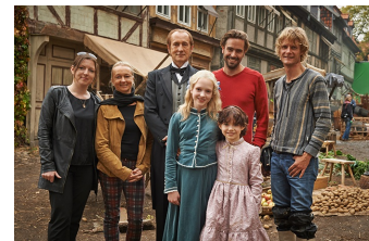
Heidi (Halberstadt, Quedlinburg)