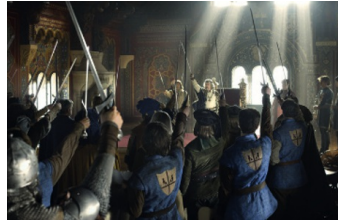
Der Brief für den König