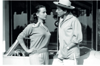
Rivalen am Steuer