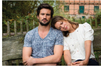
Stadtlandliebe (Blankenburg, Thale)