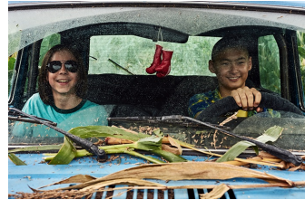
Tschick (Blankenburg, Thale)