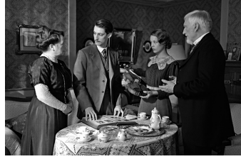
Frantz (Blankenburg, Friedrichsbrunn)