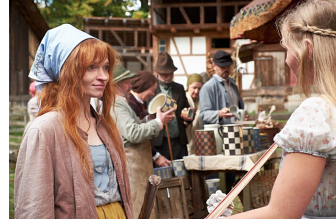
Die kleine Hexe (Blankenburg)