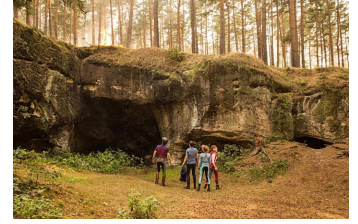
Bibi und Tina - Mädchen gegen Jungs (Blankenburg, Rübeland, Thale)