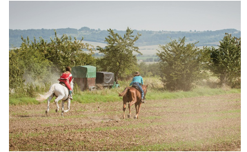
Bibi und Tina - Voll verhext (Blankenburg, Thale)