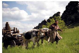
Black Death (Blankenburg, Thale)