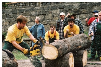
Die Könige der Nutzholzgewinnung