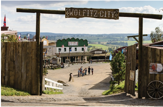
Winnetous Sohn (Blankenburg, Hasselfelde, Thale)