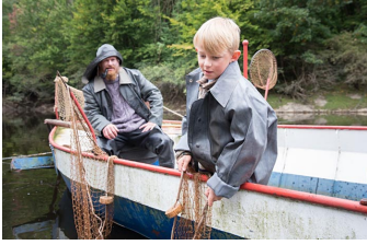
Der Krieg und ich - Kindheit im Zweiten Weltkrieg (Blankenburg, Thale)