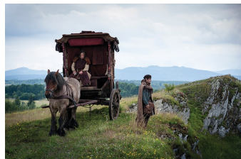
Der Medicus (Blankenburg, Elbingerode, Thale)