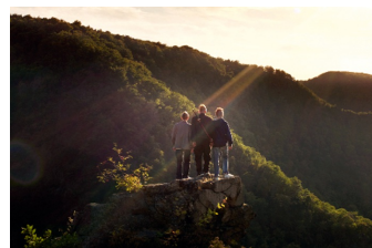
Wenn die Welt uns gehört (Thale)