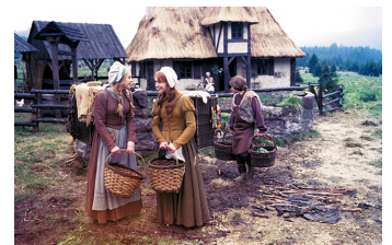
Schneeweißchen und Rosenrot (DEFA 1979)

Filmdatenbank der MDM unter: www.mdm-online.de > Film Commission > Drehreport