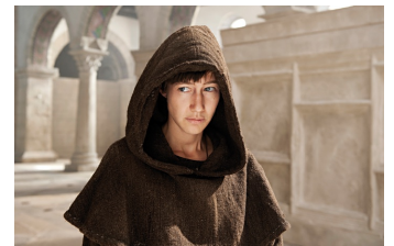
Die Päpstin (Ilsenburg)