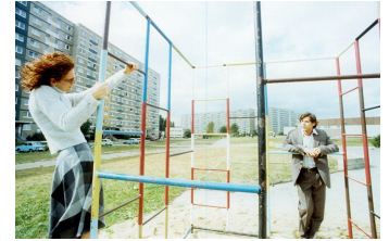
Die Stille nach dem Schuß

Filmdatenbank der MDM unter www.mdm-online.de > Drehreport