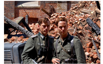
Unsere Mütter, unsere Väter