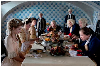
Friedrich - Ein deutscher König (Oranienbaum)