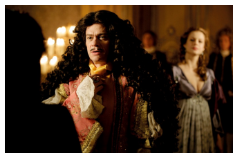
Mätressen – Die geheime Macht der Frauen