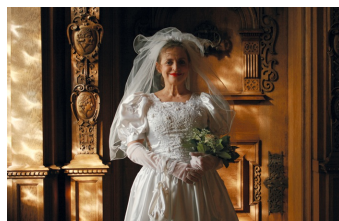
Der Mond und andere Liebhaber