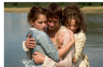
Die geliebten Schwestern