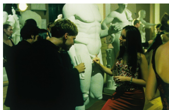
Vaya con dios