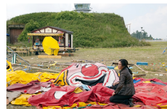
Tatort, Episode: Absturz

Filmdatenbank der MDM unter www.mdm-online.de > Drehreport