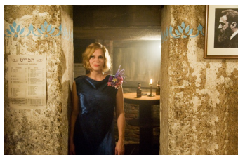
Nacht über Berlin