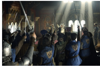
Der Brief für den König