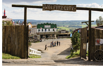
Winnetous Sohn (Halberstadt, Thale)