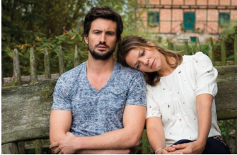
Stadlandliebe (Falkenstein, Quedlinburg)