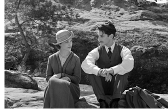
Frantz (Quedlinburg, Wernigerode)