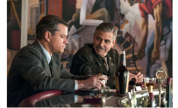
The Monuments Men (Halberstadt, Osterwieck)