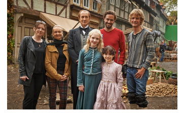
Heidi (Halberstadt, Quedlinburg)