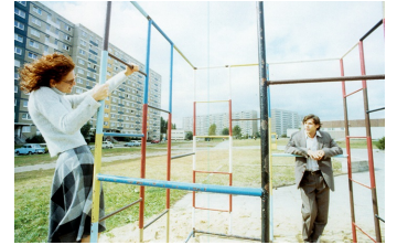
Die Stille nach dem Schuß

Filmdatenbank der MDM unter www.mdm-online.de > Drehreport