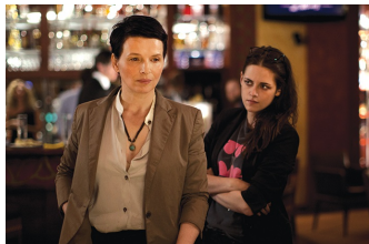
Die Wolken von Sils Maria