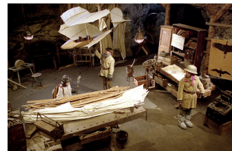
Stella und der Stern des Orients

Filmdatenbank der MDM www.mdm-online.de > Drehreport