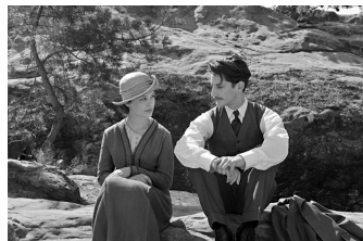
Frantz (Quedlinburg, Wernigerode)