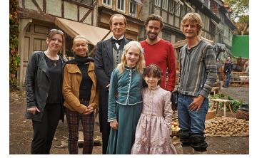
Heidi (Halberstadt, Quedlinburg)