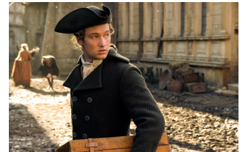
Goethe! (Osterwieck, Quedlinburg)