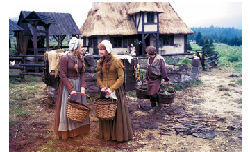
Schneeweißchen und Rosenrot (DEFA 1979)

Filmdatenbank der MDM unter: www.mdm-online.de > Film Commission > Drehreport