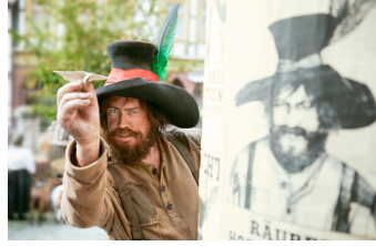
Der Räuber Hotzenplotz (Blankenburg, Quedlinburg, Langenstein)