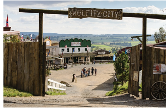
Winnetous Sohn (Halberstadt, Thale)