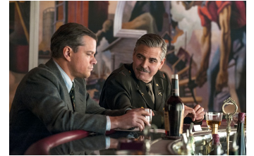
The Monuments Men (Halberstadt, Osterwieck)