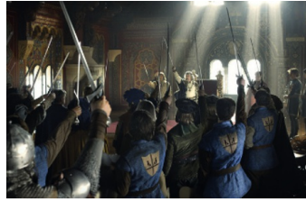
Der Brief für den König