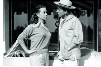
Rivalen am Steuer