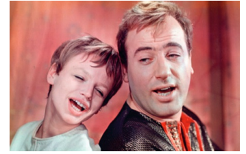
Frau Venus und ihr Teufel

Filmdatenbank der MDM unter www.mdm-online.de > Drehreport