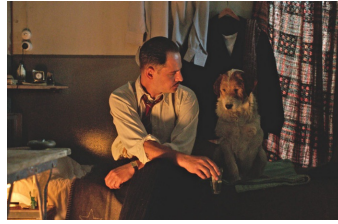
Es war einmal in Deutschland...