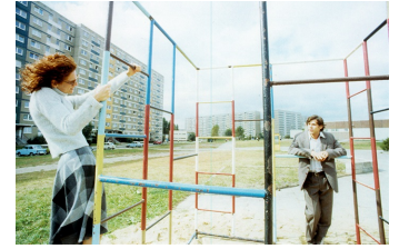
Die Stille nach dem Schuß

Filmdatenbank der MDM unter www.mdm-online.de > Drehreport