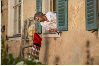
Allein unter Schwestern