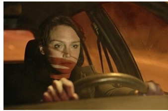
Die getäuschte Frau