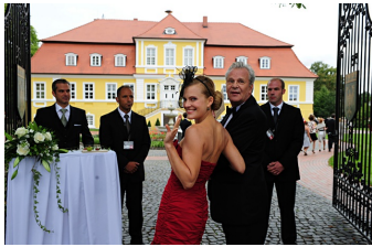
Mann tut was Mann kann