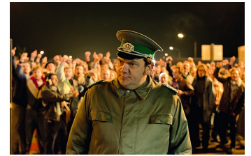
Bornholmer Straße (Wanzleben)