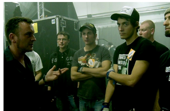
We are the Roadcrew