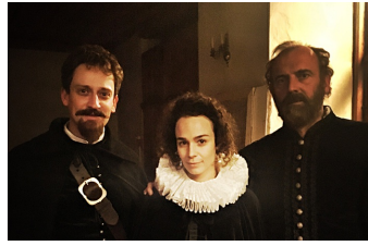
Die eiserne Zeit - Lieben und Töten im Dreißigjährigen Krieg