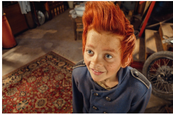
Doktor Proktors Puppulver