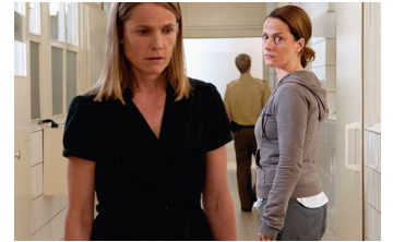
Das letzte Schweigen