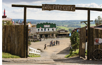
Winnetous Sohn (Halberstadt, Thale)