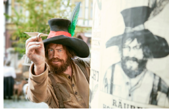
Der Räuber Hotzenplotz (Blankenburg, Quedlinburg, Langenstein)