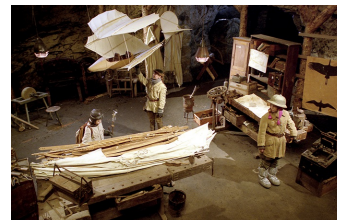
Stella und der Stern des Orients

Filmdatenbank der MDM www.mdm-online.de > Drehreport