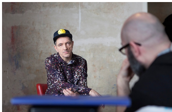
Der letzte Remix