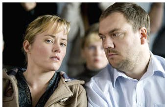
Über den Tod hinaus