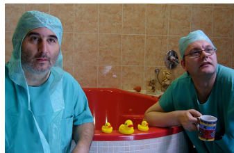
Der lange Weg ans Licht