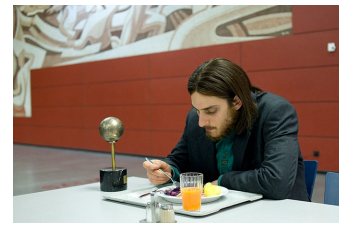
Die Einsamkeit der Primzahlen