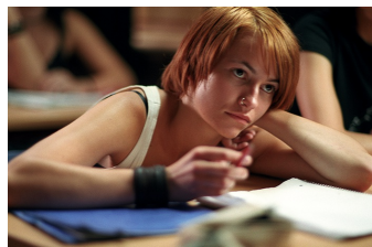
Meer is nich