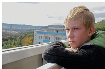
Das verlorene Lachen