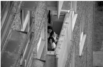
Wir sind jung. Wir sind stark.