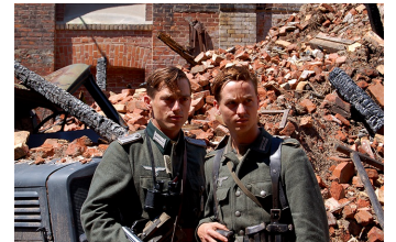
Unsere Mütter, unsere Väter