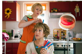
Heiter bis tödlich - Alles Klara