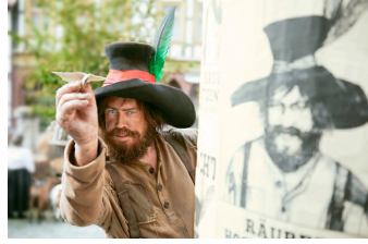
Der Räuber Hotzenplotz (Blankenburg, Quedlinburg, Langenstein)