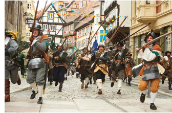
Das kleine Gespenst (Quedlinburg, Wernigerode)