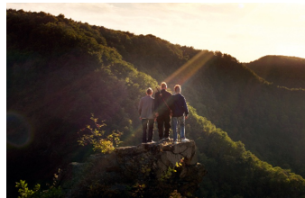
Wenn die Welt uns gehört (Halberstadt)