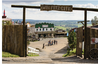
Winnetous Sohn (Halberstadt, Thale)