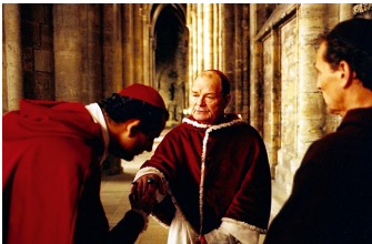
Die geheime Inquisition (Falkenstein, Gernrode, Halberstadt)