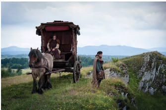
Der Medicus (Harsleben)