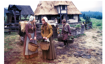
Schneeweißchen und Rosenrot (DEFA 1979)

Filmdatenbank der MDM unter: www.mdm-online.de > Film Commission > Drehreport