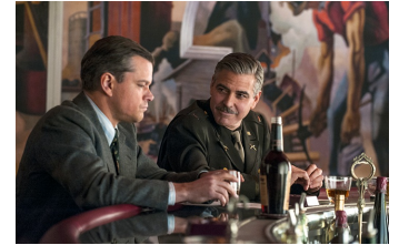
The Monuments Men (Halberstadt, Osterwieck)