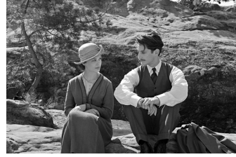
Frantz (Quedlinburg, Wernigerode)