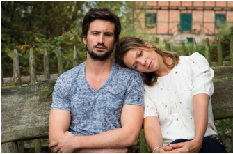
Stadlandliebe (Falkenstein, Quedlinburg)