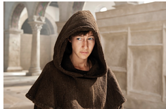
Die Päpstin (Gernrode, Harzgerode)