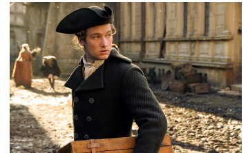
Goethe! (Osterwieck, Quedlinburg)