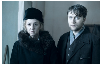
Die verlorene Zeit