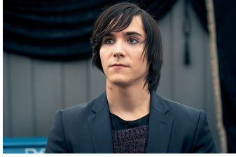
Besser als nix