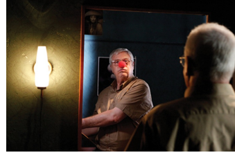
Nachts in Monte Carlo