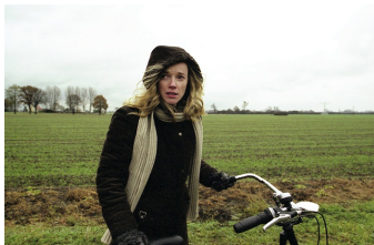
Die Zeit nach der Trauer