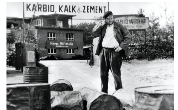
Karbid und Sauerampfer (DEFA 1963)

Filmdatenbank der MDM unter: www.mdm-online.de > Film Commission > Drehreport