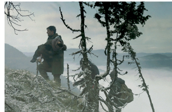
Judgment - Grenze der Hoffnung