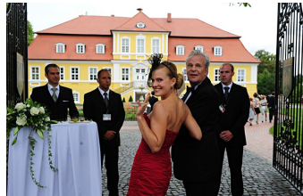
Mann tut was Mann kann