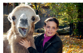
Tierärztin Dr. Mertens

Filmdatenbank der MDM www.mdm-online.de > Drehreport