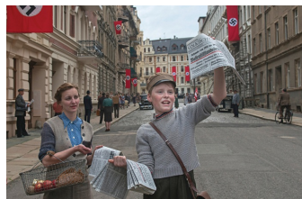
Jeder stirbt für sich allein