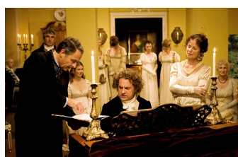
Giganten - Ludwig von Beethoven