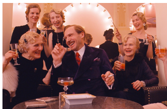
Grand Budapest Hotel