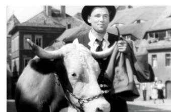
Der Ochse von Kulm

Liste von Dreharbeiten in der Stadt Görlitz www.goerlitz.de/Goerliwood-Filmografie.html