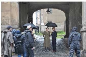
Auf Wiedersehen Deutschland