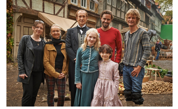
Heidi (Halberstadt, Quedlinburg)