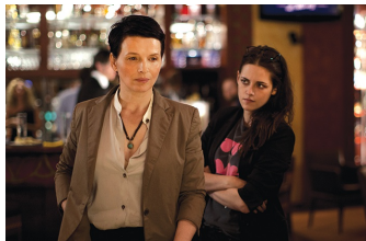
Die Wolken von Sils Maria