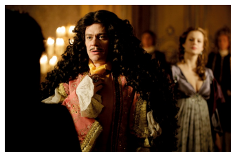
Mätressen – Die geheime Macht der Frauen