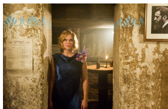
Nacht über Berlin