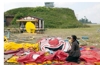
Tatort, Episode: Absturz

Filmdatenbank der MDM unter www.mdm-online.de > Drehreport