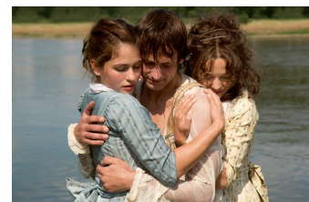
Die geliebten Schwestern