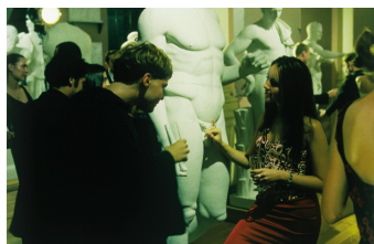
Vaya con dios