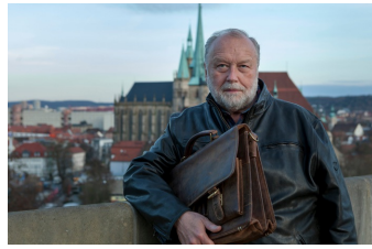
Der namenlose Tag