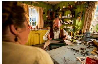
Petterson und Findus