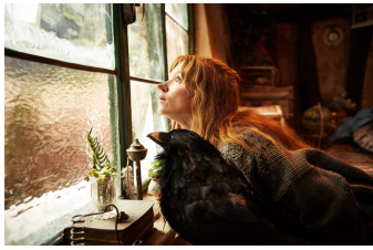
Die kleine Hexe