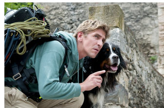
Löwenzahn – Das Kinoabenteuer