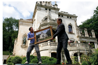
Wie erziehe ich meine Eltern