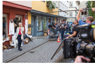
In aller Freundschaft – Die jungen Ärzte