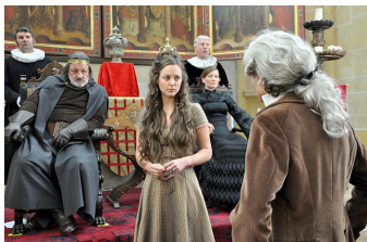
Der Teufel mit den drei goldenen Haaren