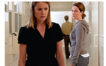
Das letzte Schweigen