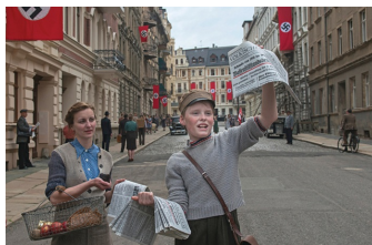
Jeder stirbt für sich allein