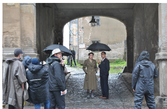
Auf Wiedersehen Deutschland