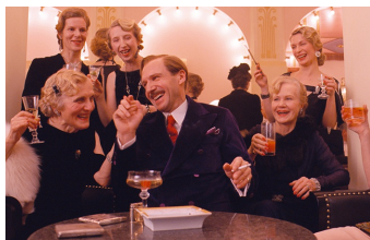
Grand Budapest Hotel