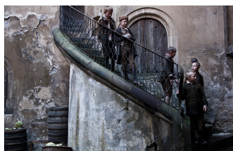
Die Vermessung der Welt