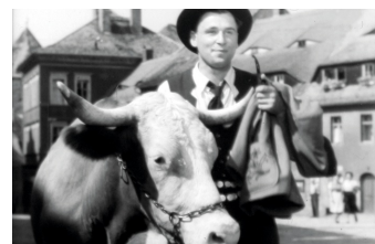
Der Ochse von Kulm

Liste von Dreharbeiten in der Stadt Görlitz www.goerlitz.de/Goerliwood-Filmografie.html