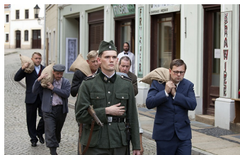
Zweiter Weltkrieg - Das erste Opfer