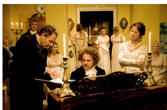
Giganten - Ludwig von Beethoven