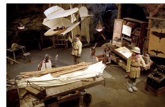
Stella und der Stern des Orients

Filmdatenbank der MDM www.mdm-online.de > Drehreport