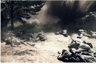
Wir waren Kameraden - das Ende