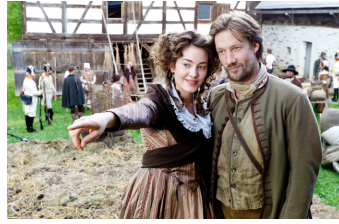
Geschichte Mitteldeutschlands: Karl Stülpner