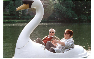
Der zweite Frühling

Filmdatenbank der MDM: www.mdm-online.de > Drehreport