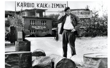
Karbid und Sauerampfer (DEFA 1963)

Filmdatenbank der MDM unter: www.mdm-online.de > Film Commission > Drehreport