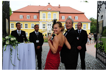
Mann tut was Mann kann