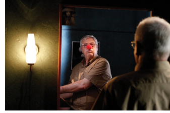
Nachts in Monte Carlo