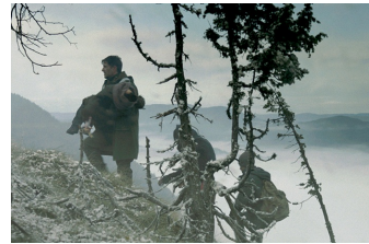
Judgment - Grenze der Hoffnung